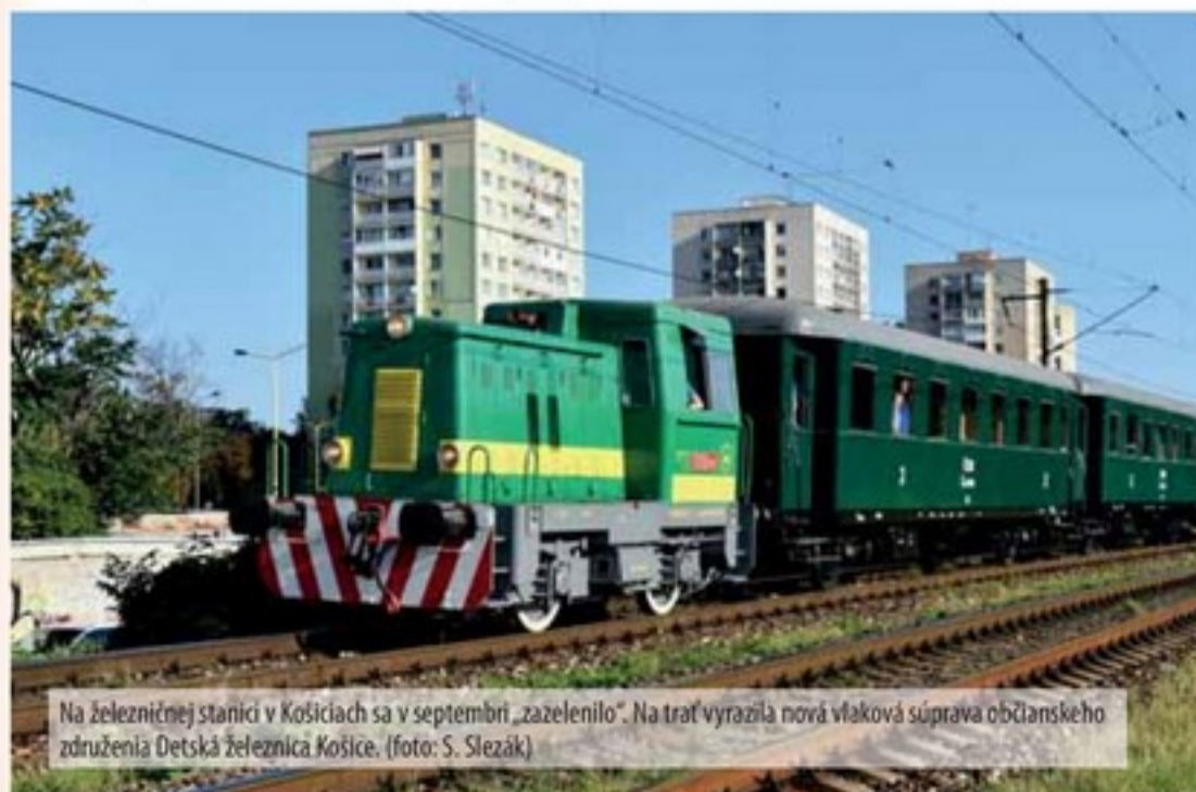
Na železničnej stanici v Košiciach sa v septembri „zazelenilo“. Na trať vyrazila nová vlaková súprava občianskeho združenia Detská železnica Košice.