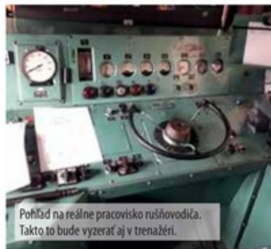
Pohľad na reálne pracovisko rušňovodiča. Takto to bude vyzerať aj v trénažeri.