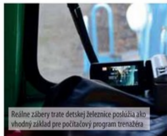
Reálne zábery trate detskej železnice poslužia ako vhodný základ pre počítačový program trénažera

Slavomír: Na čelných sklách budú umiestnené dva monitory, na ktorých sa zobrazí reálna trať. Vybrali sme si úsek Margecany - Banská Bystrica, pretože práve na nej sa tieto lokomotívy preslávia najviac. Bolo to najmä na niekdajšom rýchliku Horehroniec (bývalé označenie 810 - 811). Táto trať je pre svoju pestrosť a rôznorodosť právom považo-