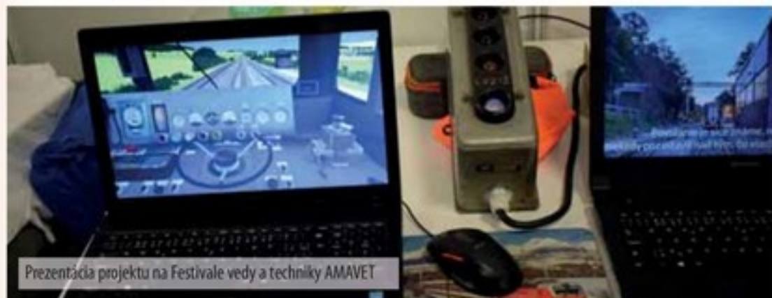
Prezentácia projektu na Festivale vedy a techniky AMAVET

Podporujeme takéto aktivity poskytnutím zázemia, materiálu, fyzickou pomocou i skromnými finančnými čiastkami. Pre chlapcov a úspešných riešiteľov danej problematiky sme však vypísali aj cieľovú odmenu. Veríme, že ju užijú v zdraví, pre osoh duše i tela.