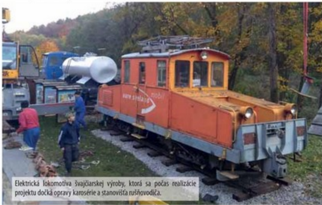
Elektrická lokomotíva švajčiarskej výroby, ktorá sa počas realizácie projektu dočká opravy karosérie a stanovišťa rušňovodča.

Okrem tohto projektu očakáva detská železnica ešte rozhodnutie o zaujímavom spoločnom projekte s partnerom z Ukrajiny. Aj v tomto prípade ide samozrejme o rozvoj železničnej histórie u nás a u nášho východného suseda.