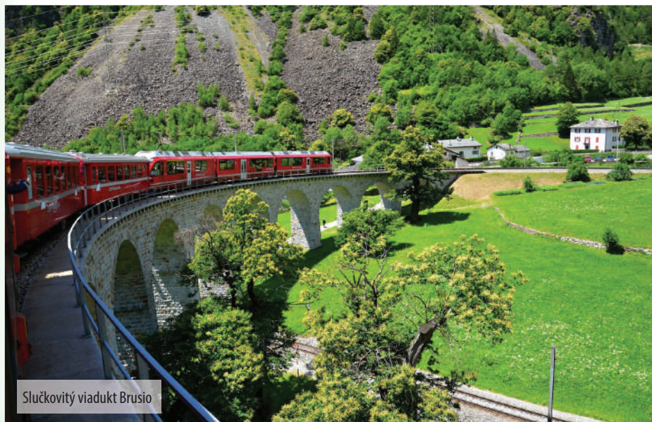
Slučkovitý viadukt Brusio