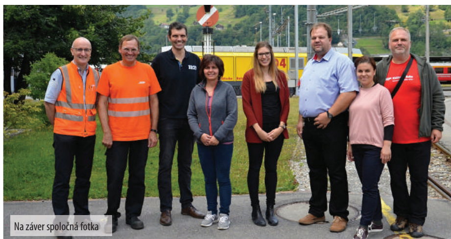
Na záver spoločná fotka

Myslíme si, že sa máme od RhB čo učiť. Nie len na našej miniatúrnej železnici, ale najmä tá veľká – štátna