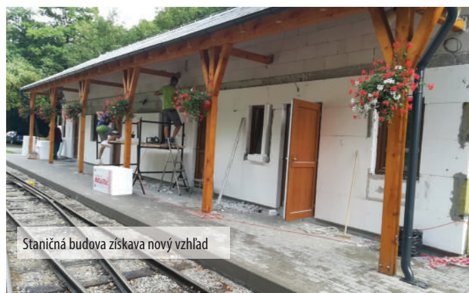
Staničná budova získava nový vzhľad