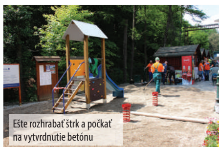
Este rozhrabať štrk a počkať na vytvrdenie betónu

ZÁPLAVA ORANŽOVÝCH TRIČIEK, DOBRÁ NÁLADA, IDEÁLNE POČASIE A VELA DOBRÝCH ĽUDÍ S CHUŤOU POMÔČŤ. AJ TAKÚTO PODOBU MALA SOBOTA 19. MÁJA NA DETSKEJ ŽELEZNICI V KOŠICIACH, KDE SA OPĚT ZIŠLA SKVELÁ PARTIA HUTNÍKOV. POSTAVILI DETSKÉ IHRISKO, PÓDIUM, VYSADILI ŽIVÝ PLOT A VYMAĽOVALI PRELIEZKY. LEN TAK.