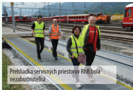
Prehliadka servisných priestorov RhB bola nezabudnuteľná

Ak ste niekedy stáli nad miniatúrnym modelovým koľajiskom a dívali ste