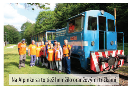
Na Alpinke sa to tiež hemžilo oranžovými tričkami

Výstavbu detského ihriska a živého plota finančne podporila Nadácia VUB. ĎAKUJEME.