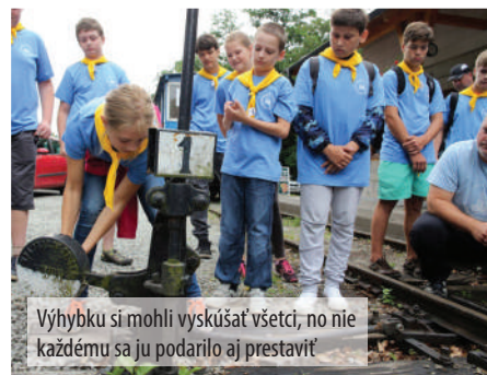
Výhybku si mohli vyskúšať všetci, no nie každému sa ju podarilo aj prestaviť

Medzi najobľúbenejšie činnosti už tradične patrila kontrola cestovných lístkov a prestavovanie výhybky, ktorá váži viac ako 10 kíl, no s pomocou dospelého sa to v prvý deň podarilo každému záujemcovi,” doplnil inštruktor J. Mačaj. Noví členovia Klubu mladých železničiarov neskrývali nadšenie a nedočkavosť, kedy budú môcť práve získané vedomosti uplatniť vo svojej prvej naozajstnej službe. Prajeme vám veľa úspechov!