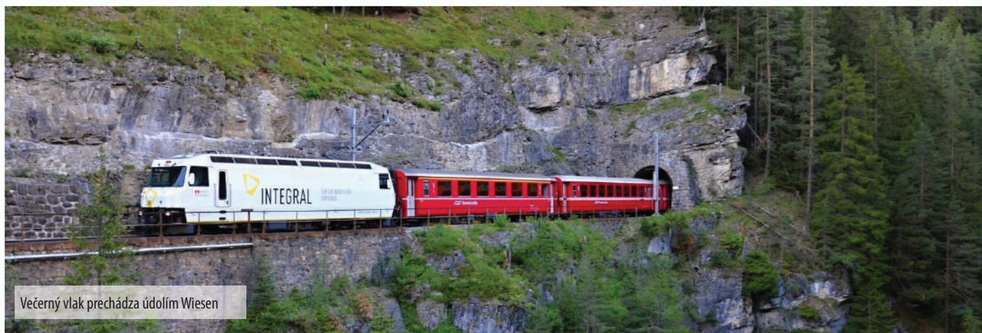
Večerný vlak prechádza údolím Wiesen

tomu šikovnému „stavitelskému triku“ dostáva o niekoľko metrov vyššie. Pohľady z okna na okolitú prírodu nenechali nikoho chladnými. Lúky plné kvetov a šťavnatej trávy, ktorú neustále ochutnávali nespočetné stáda kráv a čriedy oviec i kôz. Dolinky sa striedali so zalesnenými kopcami, pod ktorými sa na strmých svahoch pod mohutnými štítmí vytŕčali malé dedinky. A všade končiare obsypané snehom aj v tom najhorúcejšom lete, odrážali sa v hladinách jazier a plies, ktoré žiarili nevidanými farbami... naozaj každý si tu nájde to svoje.