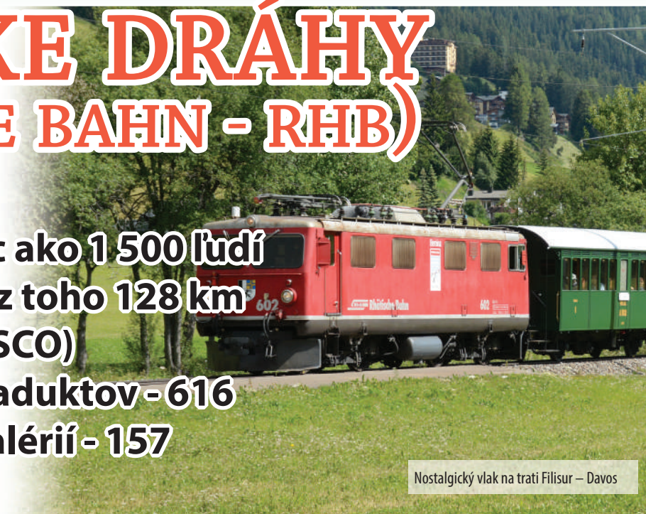
Nostalgický vlak na trati Filisur – Davos