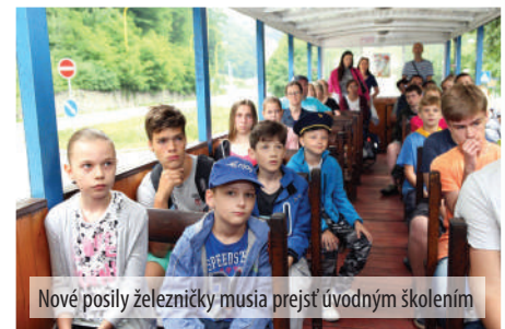
Nové posily železničky musia prejsť úvodným školením