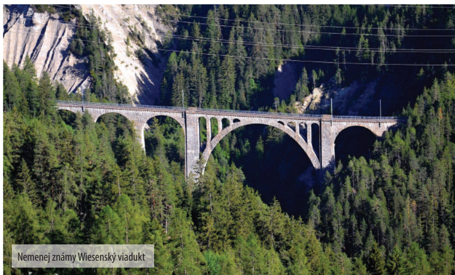
Nemenej známy Wiesenský viadukt

Po krátkej oficiálnej „zoznamovačke“ a prezentácii oboch železničiek nás obliekli do reflexných viest, nasadili sme si ochranné okuliare a vydali sa na nezabudnuteľnú prehliadku zázemia RhB. Už v úvode sme zistili, že dôležitosť (na rozdiel od železníc na Slovensku) prikladajú