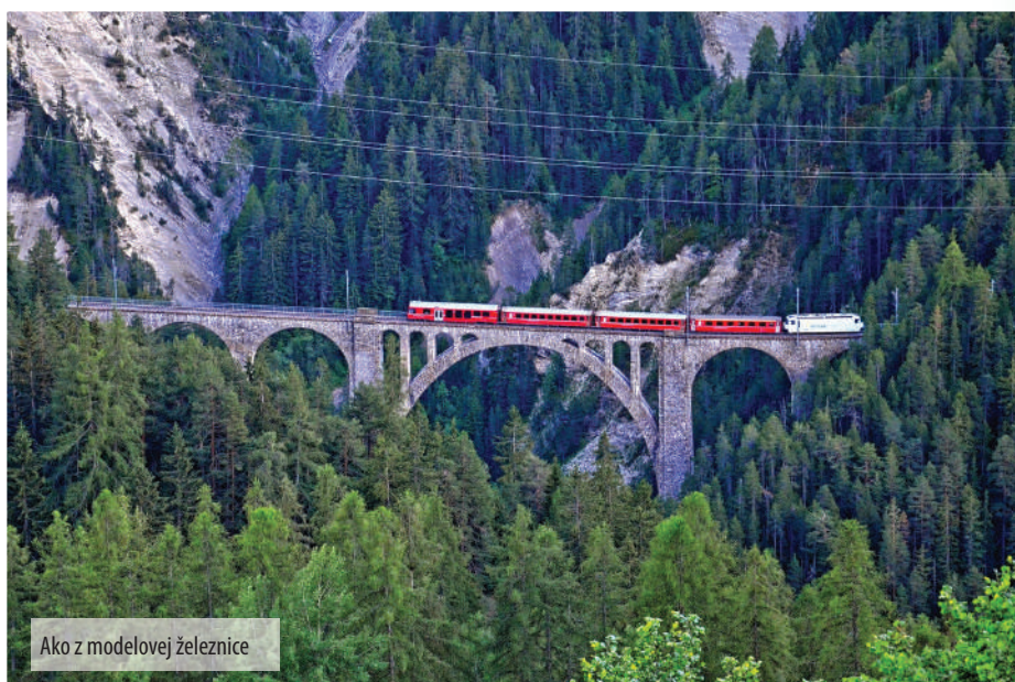
Ako z modelovej železnice