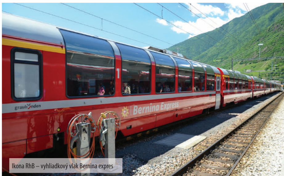
Ikona RhB – vyhládokový vlak Bernina expres

Napriek všetkému má s detskou železnicou v Košiciach predsa len niečo spoločné: množstvo zvedavých turistov a už spomínaný rozchod koľajníc - 1000 mm.