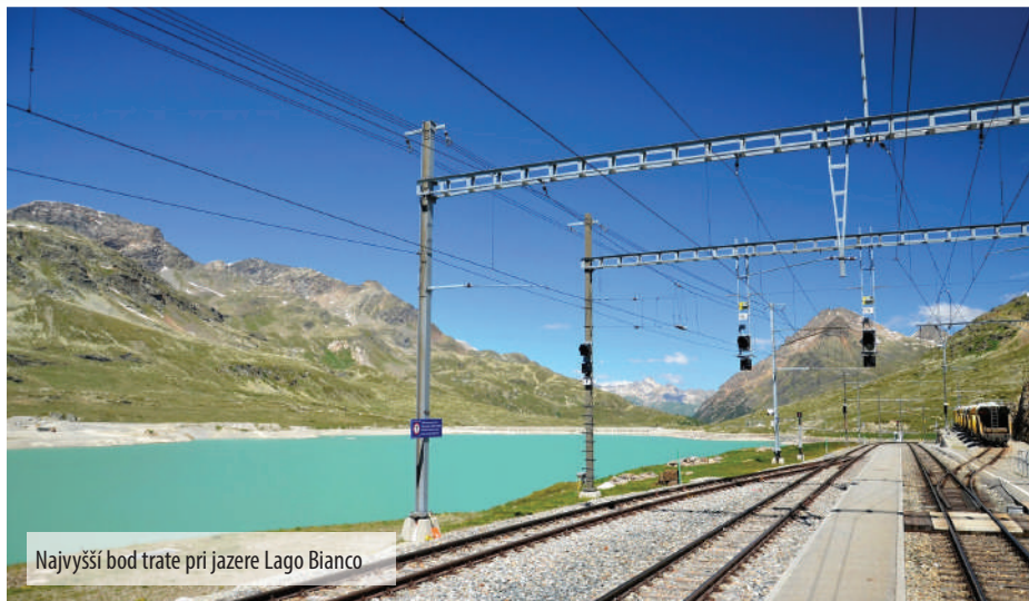
Najvyšší bod trate pri jazere Lago Bianco

Naše spoznávanie rozprávko krásnej časti krajiny začalo v stanici Davos-Wiesen, v tesnej blízkosti svetoznámych viaduktov Landwasser a Wiesen. S niekoľkými prestupmi sme smerovali do priesmyku pod 4049 m vysokým štítom Bernina. V tomto úseku koľaj