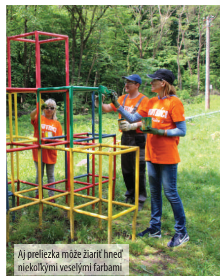
Aj preliezka môže žiariť hneď niekoľkými veselými farbami

Oranžovými tričkami sa to od rána hmyrilo aj na konečnej stanici Alpinka. Na dob-