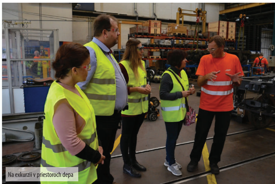
Na exkurzii v priestoroch depa

Samozrejme, treba pripomenúť, že okrem čistoty bolo všade vidieť kvety, milých a usmievavých ľudí a spokojných pracovníkov, ktorí za svoju poctivo odvedenú prácu dostávajú aj spravodlivú odmenu.