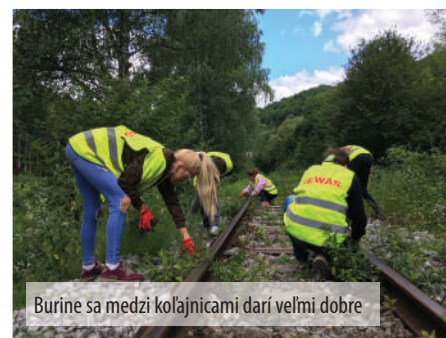
Burine sa medzi koľajnicami darí veľmi dobre

Toto leto sa v spolupráci s Košickou detskou historickou železniciou a za podpory Fondu zdravia mesta Košice rozhodli zorganizovať dobrovoľnícku akciu s názvom „Revitalizácia trate detskej železničky“. Vydarené trojdnie prinieslo svoje ovocie v podobe upra-