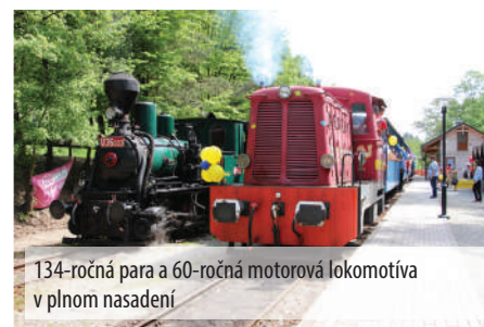
134-ročná para a 60-ročná motorová lokomotíva v plnom nasadení

na prázdniny je už takmer zaplnený. Okrem jazdenia v Čermelskom údolí pozývame aj na naše nostalgické výlety po regióne. 21. júla sa vyberieme za pamiatkami UNESCO do Dobšinskej ľadovej jaskyne, 11. augusta zavítame na Štítnické hradné hry do Štítnika a Ochtinskej aragonitovej jaskyne, 18.8. vyrazíme na Kaštielne dni do Jelšavy a Muráňa a 25.8. pôjdeme do Bardejova na Bardejovský jarmok. V septembri a októbri nás ešte čakajú ďalšie jazdy.