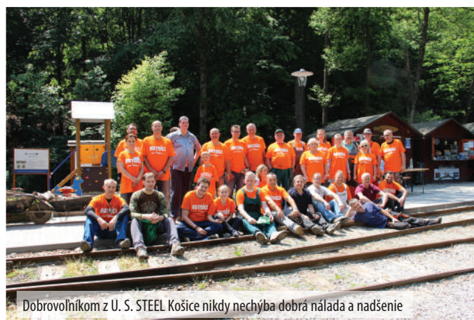
Dobrovoľníkom z U. S. STEEL Košice nikdy nechýba dobrá nálada a nadšenie

rovoľníkov tu čakala výzva v podobe stavby dreveného pódia a vymalovania kovových preliezok. Práca išla od ruky a odmenu v podobe výdatného guláša si po vydarenej prá-