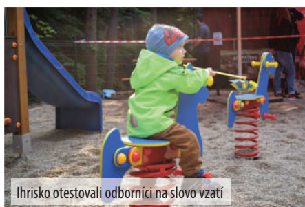
Ihrisko otestovali odborníci na slovo vzatí