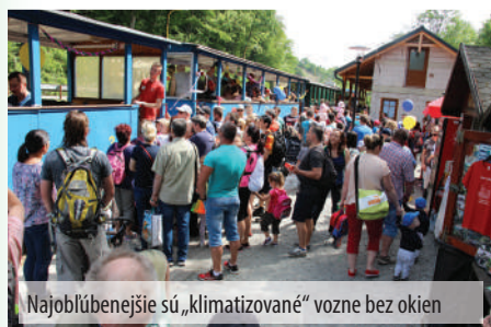
Najobľúbenejšie sú „klimatizované“ vozne bez okien

Na leto sa vždy všetci tešíme. Jazdíme každý deň. Každé prázdniny sú pre nás výzvou. V prípade väčšieho počtu cestujúcich, alebo detských táborov či skupinových výletov sme pripravení vypraviť aj mimoriadne vlaky. Cez pracovné dni jazdia motorové lokomotívy Janka, Danka a už čoskoro k nim pribudne