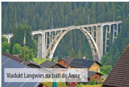
Viadukt Langwies na trati do Arosy