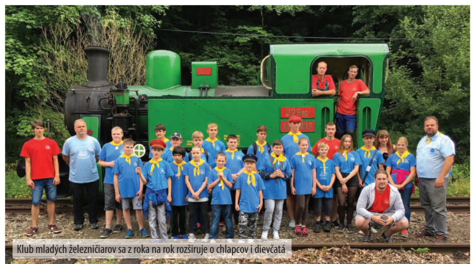
Klub mladých železničiarov sa z roka na rok rozširuje o chlapcov i dievčatá

Medzi najobľúbenejšie činnosti už tradične patrila kontrola cestovných lístkov a prestavovanie výhybky, ktorá váži viac ako 10 kíl, no s pomocou dospelého sa to v prvý deň podarilo každému záujemcovi,” doplnil inštruktor J. Mačaj. Noví členovia Klubu mladých železničiarov neskrývali nadšenie a nedočkavosť, kedy budú môcť práve získané vedomosti uplatniť vo svojej prvej naozajstnej službe. Prajeme vám veľa úspechov!