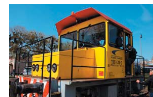
Rušeň série 199

Do pôvodnej motorovej rušne namontovali akumulátorové batérie a dnes sa používa výhradne na posun. Bez privesenej záťaže prejde na jedno nabitie cca 105 km. Záťaž 100 ton odťahne do vzdialenosti 30 km a 230 ton do vzdialenosti 16 km. Samotný rušeň váži 23 ton. Má tichý chod, elektrický pohon neprodukuje emisie, preto je vhodný aj pre dlhodobejší posun v uzavretých halách.