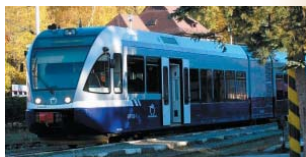
Dieselmotorová jednotka série 840 - Vrana

Dieselmotorová jednotka série 840 jazdí na Slovensku od roku 2003. Celkom 6 kusov vyrobilo konzorcium firiem Stadler, Bombardier a ŽOS Vrútky. Je to jediné vozidlo ZSSK, ktoré má motor Mercedes. Maximálna rýchlosť