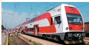
Elektrická poschodová jednotka série 671

Jednotka je konštruovaná na rýchlosť 160 km/h, čo je maximálna rýchlosť na koridorových tratiach ŽSR. EPJ má vysoké zrýchlenie, rýchlosť z 0 na 120 km/h dosiahne za 65 sekúnd a rýchlosť 160 km/h za 90 sekúnd. Podobne je to aj so