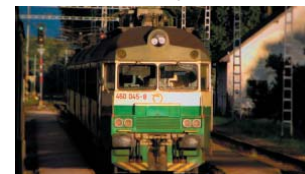
Elektrická jednotka série 460 - Pantograf

„Pantograf“ – pod týmto menom ho poznajú železničiarim i cestujúci, má pred sebou možno posledný rok prevádzky. Vo svojich začiatkoch, okolo roku 1976, to bol moderný vlak, s centrálnym zatváraním dverí. Ľudia si ho obľúbili, hoci cesta vlakom z Košíc do 30 km vzdialeného Prešova trvá o 10 minút viac ako autobusom. Postupne ho nahrádzajú elektrické poschodové jednotky 671.