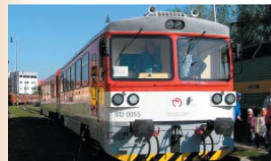
Motorová jednotka série 813 - Bageta

Názov „Bageta“ preto, lebo je poskladaná z dvoch častí. Jazdí na lokálnych tratiach s kratšími vzdialenosťami. Motorové vozne sú v strede spojené kĺbom ako v autobusoch. Prototyp vyšiel zo