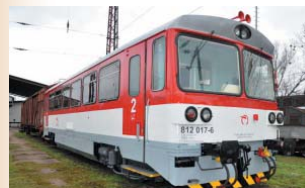
Motorový vozeň série 812

Motorový vozeň, jazdí na regionálnych tratiach. Vyrábala sa v rokoch 2002 – 2006 (64 kusov), rekonštrukciu vozidiel série 810. Okrem výkonnejšieho motora prešiel zmenami aj interiér, ktorý bol odhlučnený, dostal pohodlnejšie čalúnené sedadlá. Vo väčšine vozidiel je informačný systém, ktorý cestujúcich upozorňuje na nasledujúcu i cieľovú stanicu. Raritou je vozeň s číslom 812.008, ktorý vyrobili vo verzii LUX. Má klimatizáciu, špeciálne automatické dvere a sedadlá ako v IC vlaku.