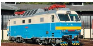
Rušeň série 350

Rušne určené, okrem iného, aj na vozbu IC vlakov na trati Bratislava – Trenčín mohli ísť vlaky Bratislava – Košice/Humenné (a späť). ZSSK celkovo vlastní 18 takýchto rušňov, z čoho 9 má nainštalované zabezpečovacie zariadenie ETCS Level 1, ktoré je podmienkou na infraštruktúre ŽSR, aby v úseku Bratislava – Trenčín mohli ísť vlaky rýchlosťou vyššou ako 120 km/h, t. j. 160 km/h. Zvyšných 9 (bez ETCS) je určených pre medzinárodnú vozbu vlakov najvyšších kategórií EC/EN na ramene Budapešť – Bratislava – Praha.