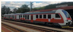
Dieselmotorová jednotka série 861

Nová moderná dieselmotorová jednotka určená pre regionálnu a medziregionálnu dopravu. Vďaka jej nasadeniu v okolí Nových Zámok a Humenného došlo k viditeľnej zmene na týchto regionálnych tratiach. Jednotky sú vybavené klimatizáciou, uzavretými toaletami, priestorom pre bicykle, kočíky či invalidné vozíky. Pri sedadlách je elektrická zásuvka 203 V, súčasťou toaliet je prebaloovací pult. Na bezpečnosť dohliada kamerový systém, informácie o vlaku prinášajú vonkajšie aj vnútorné panely doplnené zvukovým hlásením. Kostra kabíny rušňovodiča je vyrobená z ocelových profilov a spevnená kovovým rámom tak, aby odolala zrážke s kamiónom s 15 tonovou cisternou. Na Slovensku bude do konca roka 2015 premávať 32 takýchto vlakov, z toho 16 na východe na tratiach Košice – Humenné, Humenné – Stakčín, Humenné – Prešov, Humenné – Medzilaborce, Prešov – Bardejov.