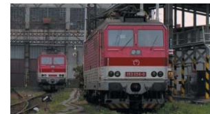
Rušeň série 163 - Persing

Železničiarim mu nepovedia inak ako Persing. Prezývku dostal podľa balistických rakiet Pershing, ktoré Američania počas studenej vojny umiestnili v Európe. S raketami mal spoločné nielen to, že mal veľmi dobré zrýchlenie (až dvojnásobné v porovnaní s predchodcom), ale pre časté poruchy mal aj «krátky dolet». Tieto škodovkárske rušne jazdili na osobných vlakoch v Československu aj v Taliansku.