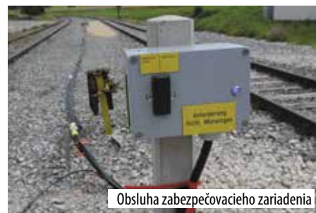
Obsluha zabezpečovacieho zariadenia

dráhe v Mönsingene, ktorá je v prevádzke práve iba počas leta a školských dní. No a v sezóne premávajú s historickými osobnými motorovými vozňami. Zaujímala nás však najmä jednoduchá a účinná obsluha zabezpečovacieho zariadenia na priecestiach, ktoré by sme radi v budúcnosti aplikovali aj na detskej železnici v Košiciach.