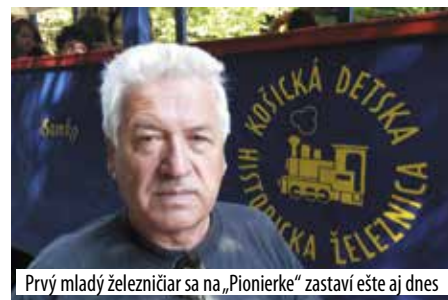
Prvý mladý železničiar sa na „Pionierke“ zastaví ešte aj dnes

Sledujem jej vývoj počas celej existencie. No chcem sa vám úprimne poďakovať za to, čo ste zo železnice urobili za posledné roky. Pred časom sme sa stretli starí páni na Alpinke a museli sme skonštatovať, že vstala z mŕtvych.