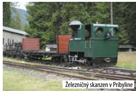
Železničný skanzen v Pribyline

V lete sme zavítali aj do Múzea liptovskej dediny v Pribyline a boli sme nemilo prekvapení. Železnička na konci múzea po minulé roky